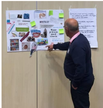
Presenteren van één van de vier collages