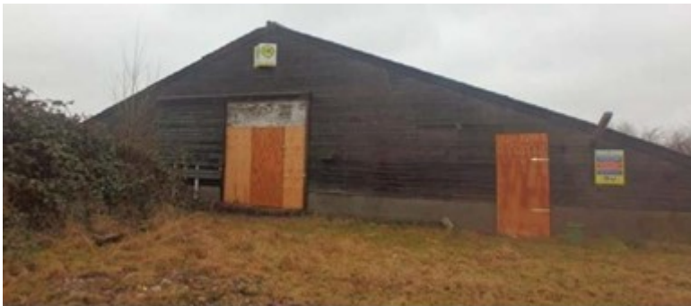
afbeelding 1: bestaande bebouwing

Op de locatie Kruisbaakweg 6 Marken staat een gebouw (afbeelding 1). Op basis van het bestemmingsplan mag een grote woning worden gebouwd. De planologische regeling is te zien in de afbeeldingen 2 (verbeelding) en 3 (regels).